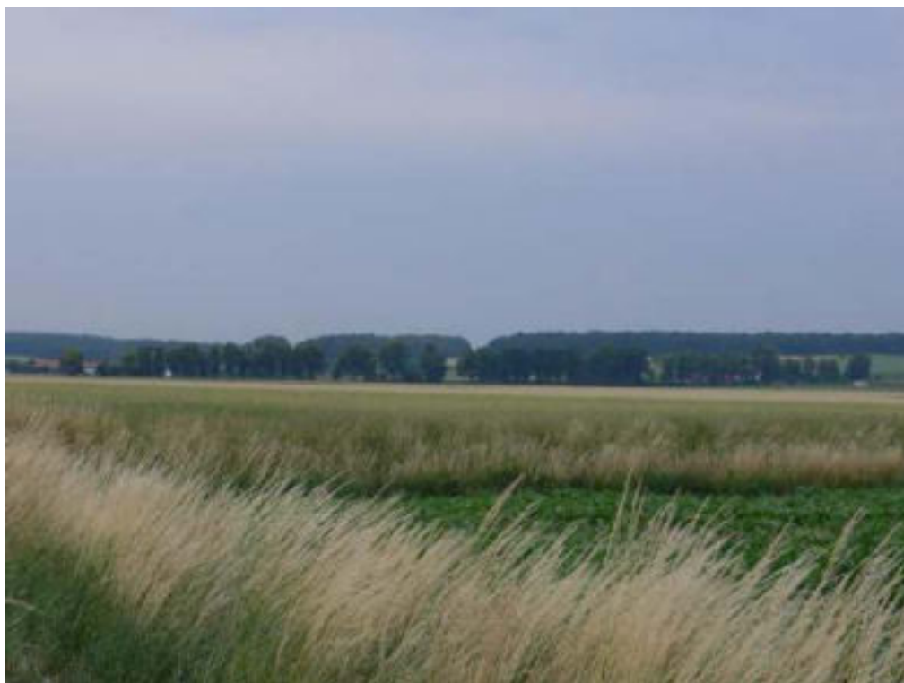
Celkový pohled na alej od obce Bříšňany