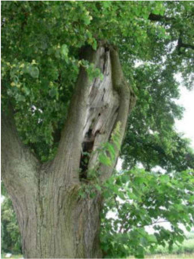
Poškození dřeviny výlomem části koruny