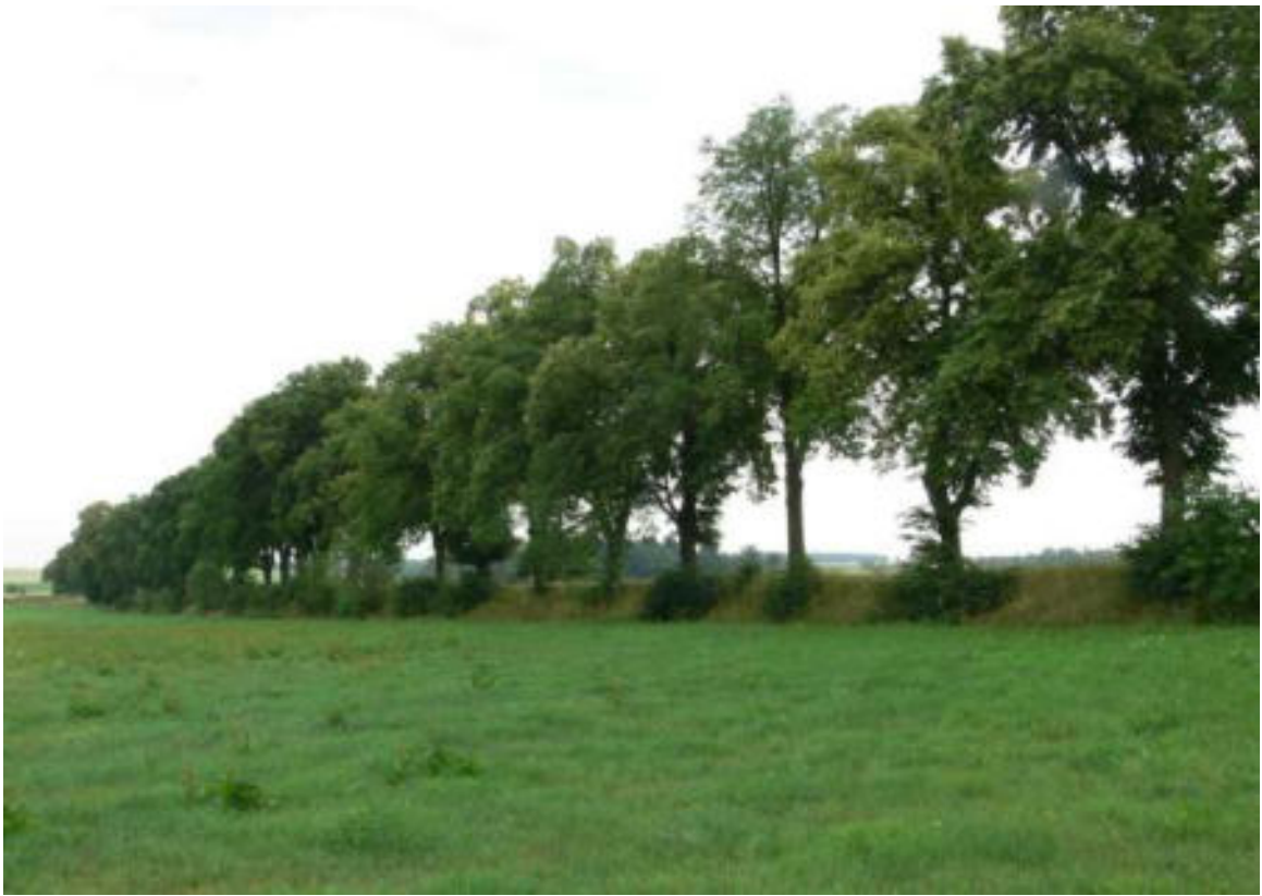
Pohled na alej od obce Petrovičky