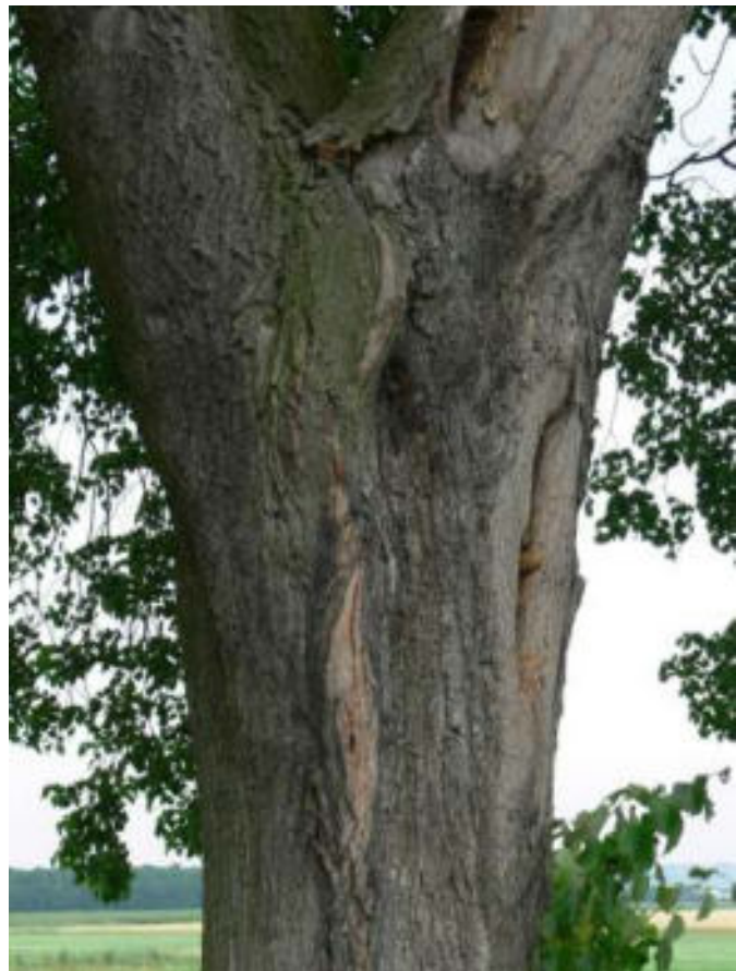
Poškození dřeviny prasklinami na kmeni