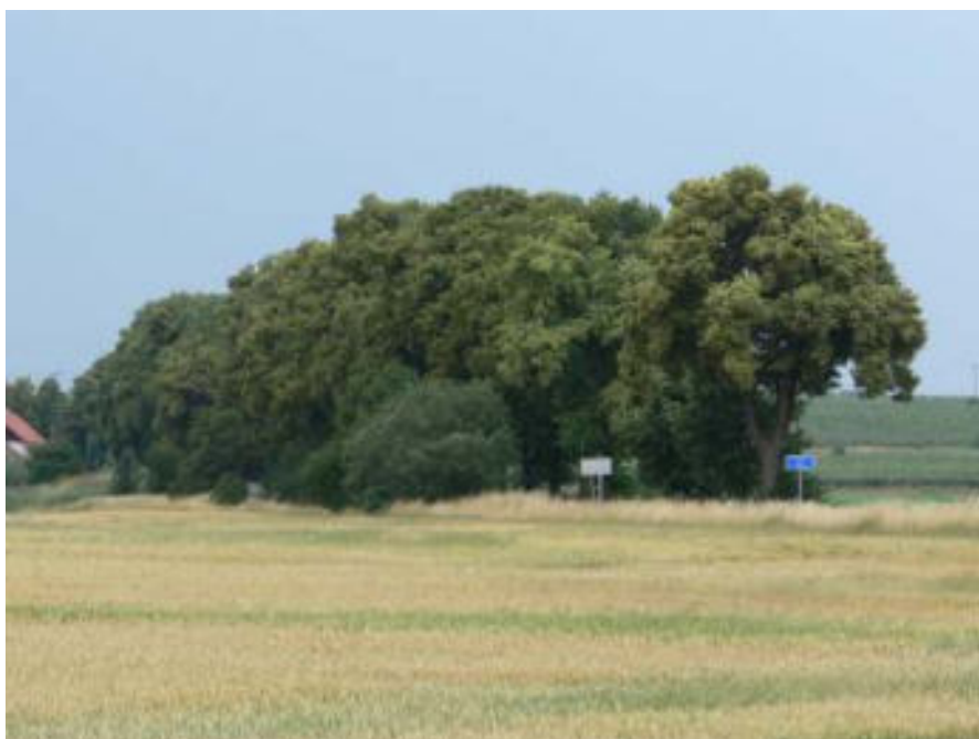
Pohled na alej od křižovatky komunikací směrem na obec Petrovičky